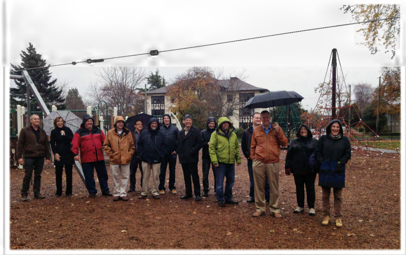
Quelques membres du comité technique de la norme CAN/CSA-Z614

Sept rencontres par téléconférence/Webex sont prévues de septembre 2018 à mars 2019 et une rencontre à Toronto pour finaliser les travaux le 30 avril et 1er mai 2019.