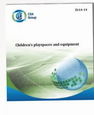
RÉVISION DE LA NORME Z614