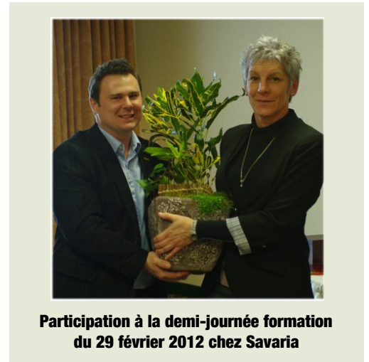
Participation à la demi-journée formation du 29 février 2012 chez Savaria